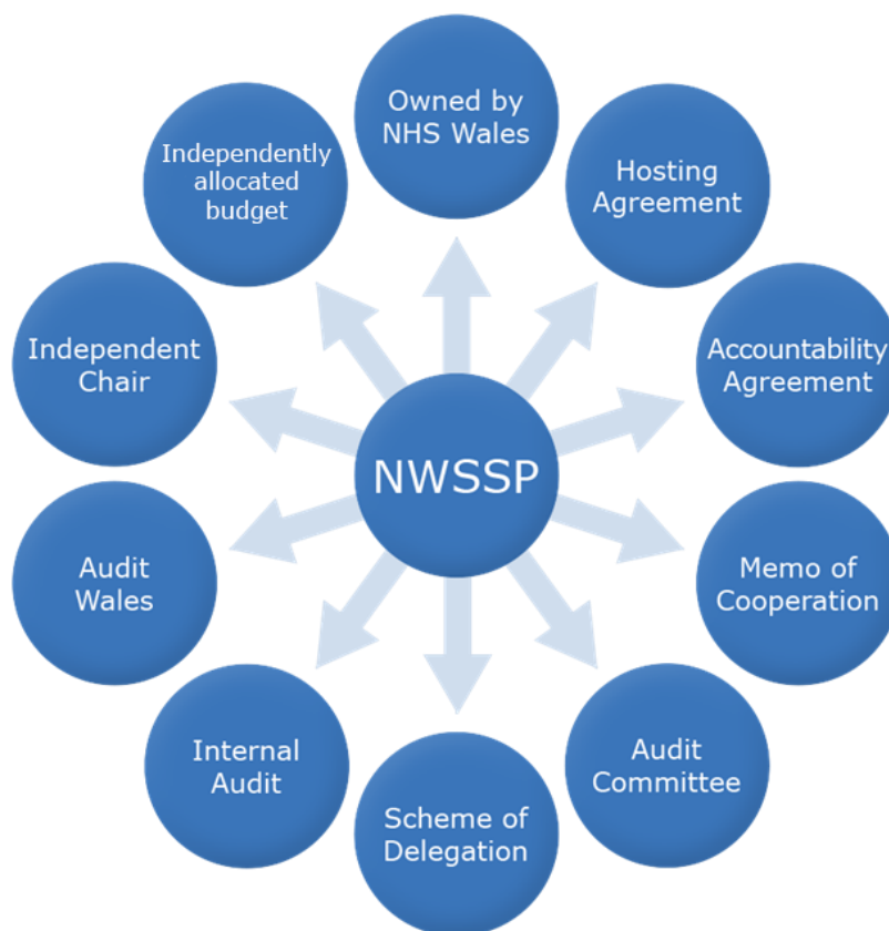
Ffigur 2: Crynodeb o'r trefniadau llywodraethu

Mae SSPC wedi rhoi Fframwaith Llywodraethu ac Atebolrwydd cadarn ar waith ar gyfer PCGC, sy'n cynnwys: