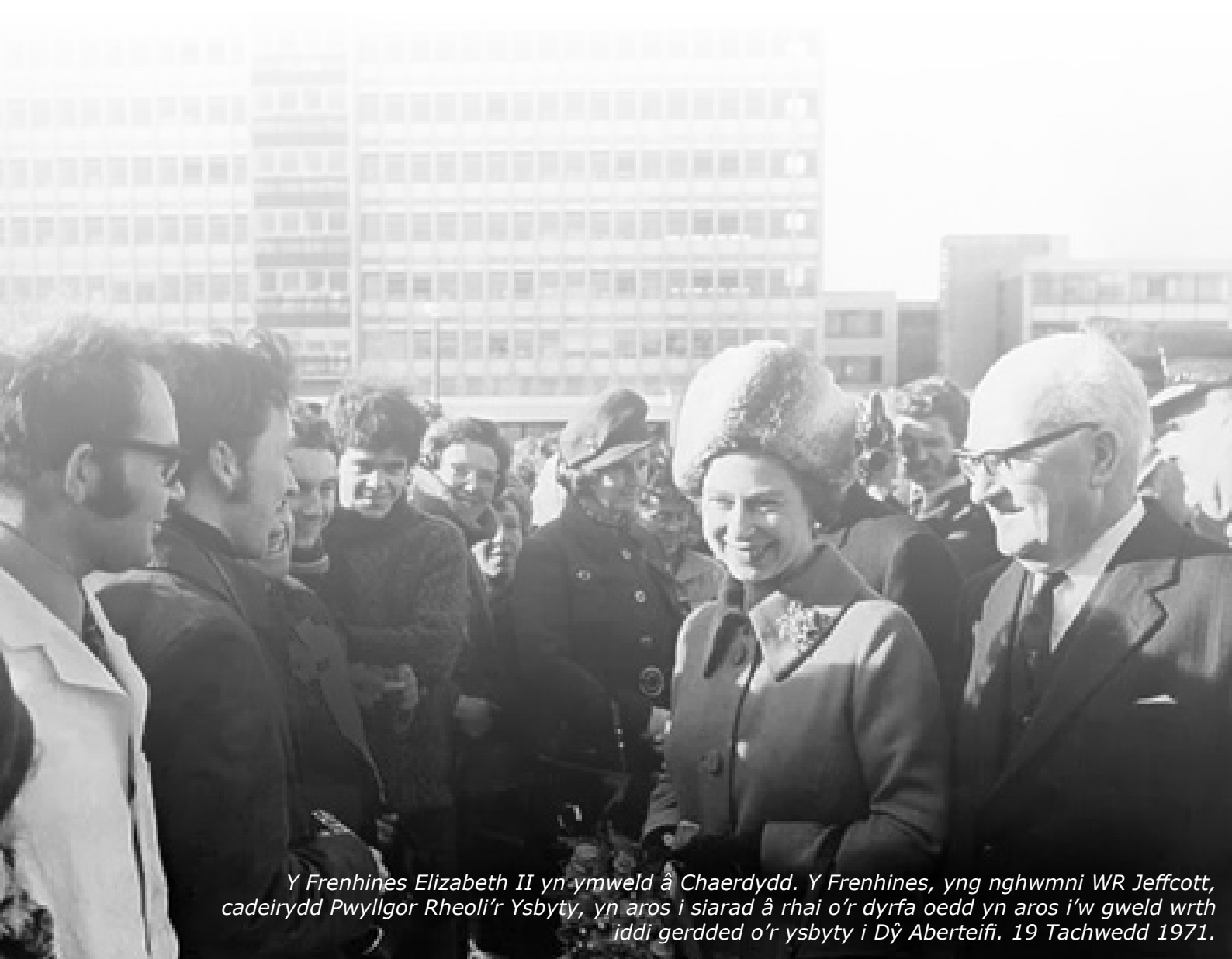
Y Frenhines Elizabeth II yn ymweld â Chaerdydd. Y Frenhines, yng nghwmni WR Jeffcott, cadeirydd Pwyllgor Rheoli'r Ysbyty, yn aros i siarad â rhai o'r dyrfa oedd yn aros i'w gweld wrth iddi gerdded o'r ysbyty i Dŷ Aberteifi. 19 Tachwedd 1971.

1986: Lansio ymgyrch iechyd AIDS gyntaf.