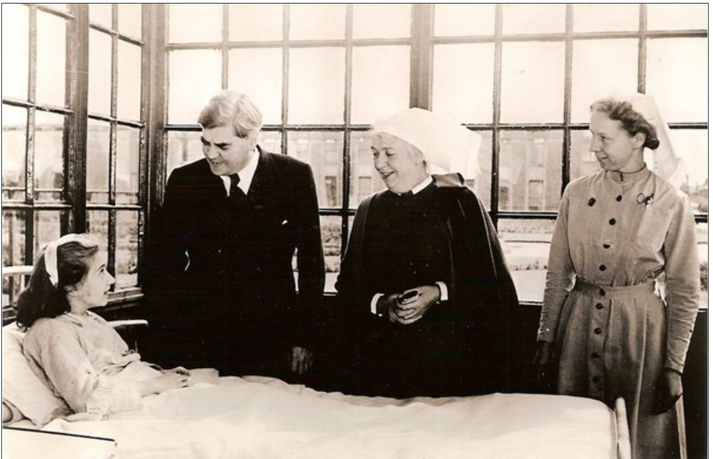
Ffigur 13 Aneurin Bevan, y Gweinidog dros Iechyd, ar ddiwrnod cyntaf y Gwasanaeth Iechyd Gwladol, 5 Gorffennaf 1948 yn Ysbyty Park, Davyhulme, ger Manceinion

Mae'r GIG yng Nghymru yn cynnwys 7 Bwrdd Iechyd, 3 Ymddiriedolaeth a 2 Awdurdod Iechyd Arbennig. Mae PCGC yn bodoli ochr yn ochr â'r sefydliadau hyn fel sefydliad cydfuddiannol annibynnol, a letyir gan Ymddiriedolaeth GIG Prifysgol Felindre.